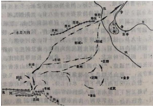
铜瓦厢决口初期流势图