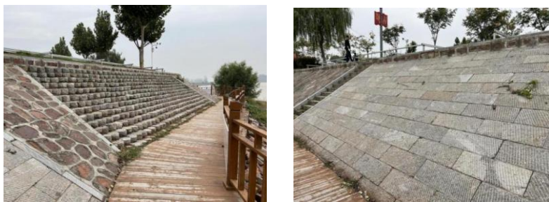
东坝头防洪工艺教学坝

4. 晚间游戏：探寻“河中石兽”——说说你怎么寻找七年级语文课本里的“河中石兽”？像寺僧、讲学家、老河兵？有没有别的方法？