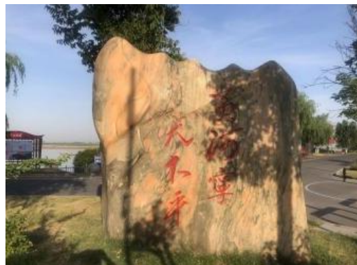
黄河宁 天下平纪念碑