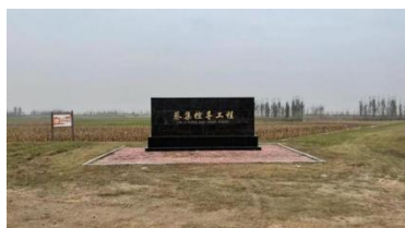
蔡集 03·8 抢险纪念地

沿 18 号堤方向采取先挂柳沉沙，柳枝加石料筑坝进占，由西向东，由浅水区向深水区推进；第三步，在两侧坝头盘实固牢的前提下，从决口东西两侧坝头同时封堵最后 46 米。无一人伤亡。