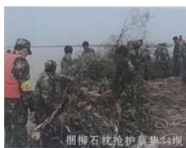
捆扎柳石埽枕抢护 34 坝