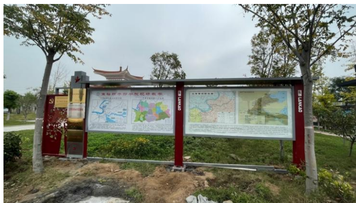
焦裕禄干部学院现场教学点